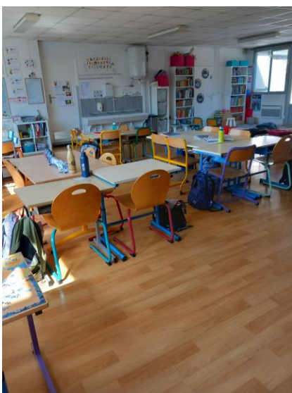
Vue d'une école